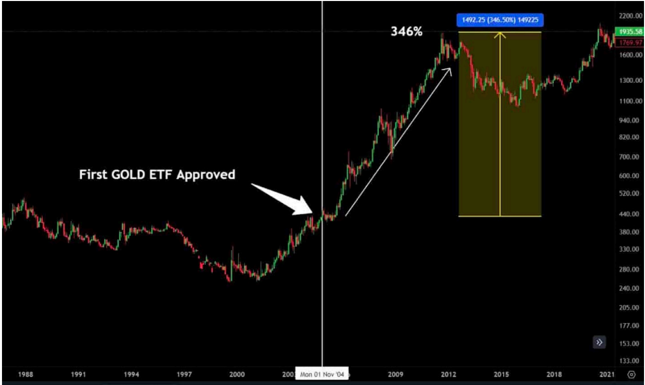
Gold's Performance after ETF Approval in 2004

ETFs die Schleusen für einen massiven Kapitalzustrom in den Goldmarkt. Die darauffolgende Rallye bei den Goldpreisen war nichts weniger als historisch und unterstrich die transformative Kraft, die solche regulatorischen Entscheidungen auf den Wert eines Rohstoffs ausüben können.