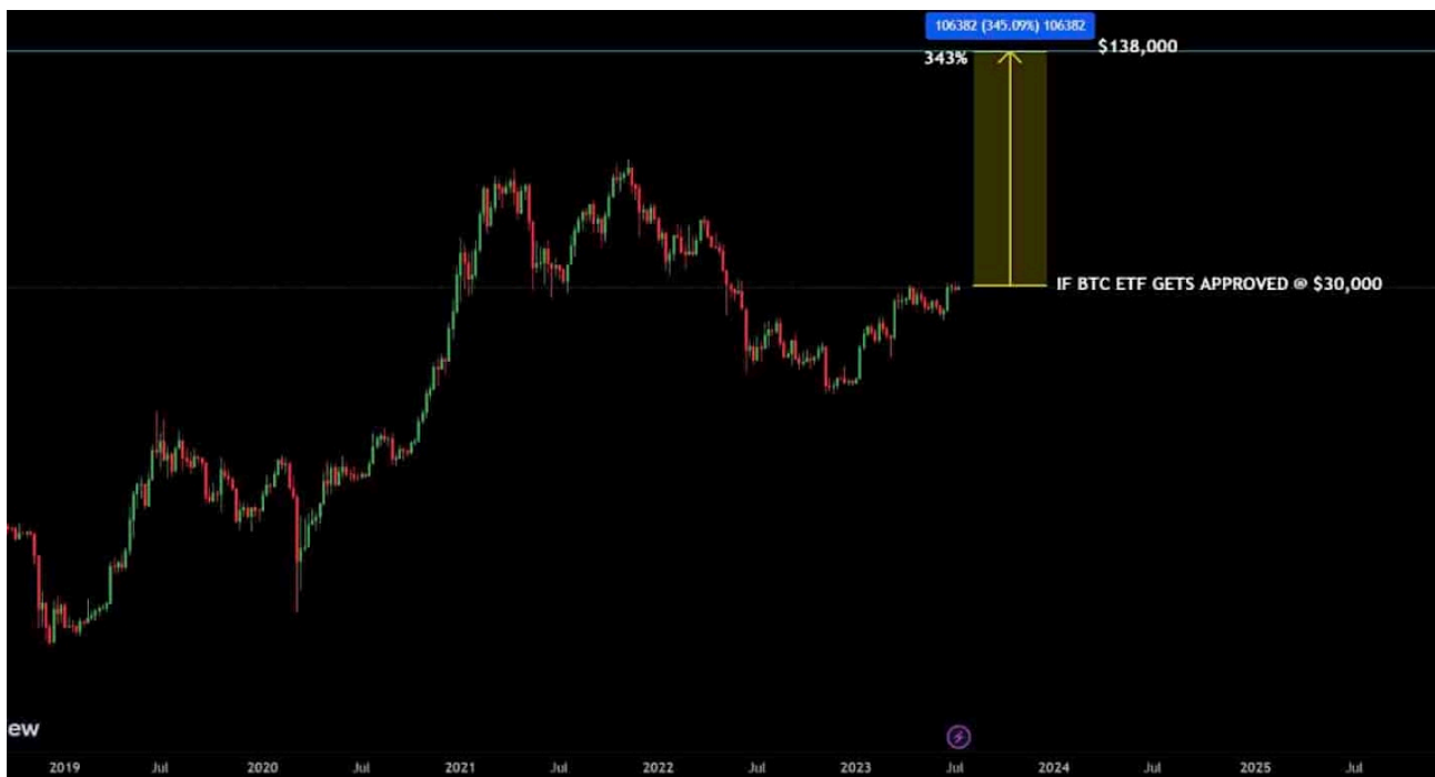
Hypothetical BTC Price Projection after Spot ETF Approval