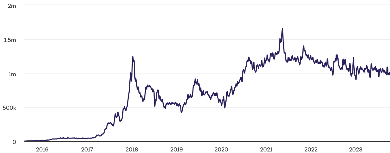
Transactions on the Ethereum Network (Daily, 7DMA)

In derselben Weise wächst, da die Bedeutung von realen Vermögenswerten in Blockchain-Netzwerken stetig zunimmt, sowohl der wahrgenommene als auch der tatsächliche Wert dieser Netzwerke. Für jeden tokenisierten Grundbesitz, jede Anleihe oder jedes Kunstwerk erhöht sich die Bedeutung der zugrunde liegenden Blockchain, da sie eine direkte Darstellung des greifbaren, realen Werts wird.